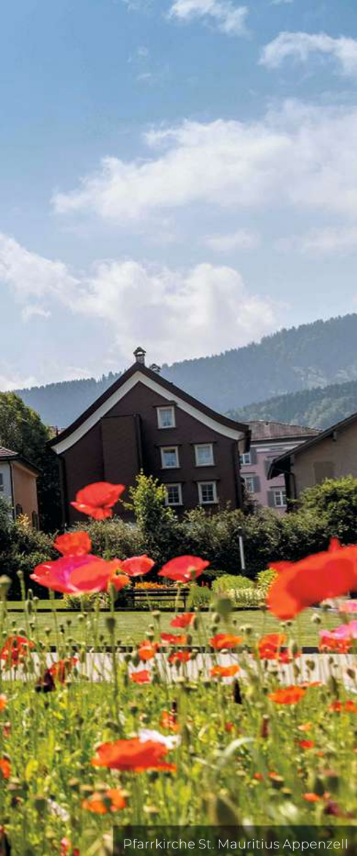
Pfarrkirche St. Mauritius Appenzell